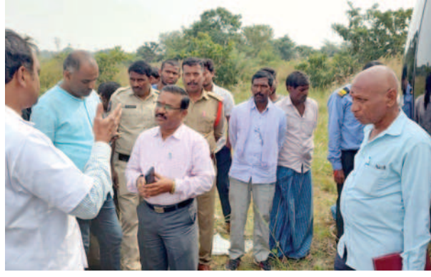
కూలిపోయిన యంత్రం గురించి వివరాలు వెల్లడిస్తున్న శాస్త్రవేత్తలు