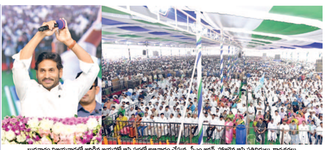
బుధవారం విజయవాడలో బిసెలకు జయహో బిసి సభలో అభివాదం చేస్తున్న సిఎం జగన్, హోజుల బిసి ప్రతినిధులు, కార్యకర్తలు

సామాజిక న్యాయానికి ప్రభుత్వం నిలువెత్తు నిదర్శనం 70% మేరకు పాలనలో బిసెలకు భాగస్వామ్యం వచ్చే ఎన్నికల్లో మారీచులకు, మంచితనానికి మధ్య పోటీ విజయవాడ 'జయహో బిసి' సభలో సిఎం జగన్ ఉద్వేగభరిత ప్రసంగం