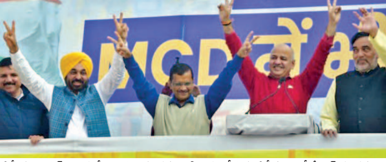
ఢిల్లీ మున్సిపల్ ఎన్నికల్లో గెలుపు అనంతరం అభివాదం చేస్తున్న ఢిల్లీ సిఎం కేజ్రీవాల్ తదితరులు